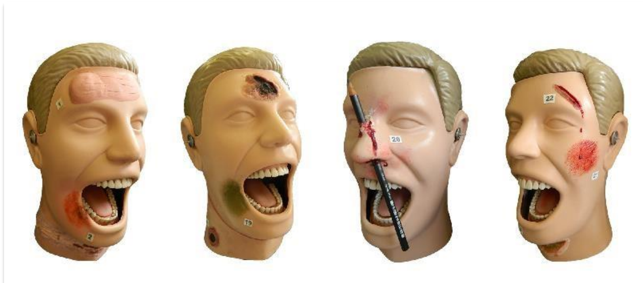
Figura 2 - Manequins modificados com lesões de ordem físico-mecânicas simuladas através de materiais sintéticos (maquiagens, massa de modelar)

numeradas de 1 a 27, compatíveis com lesões de energia de ordem mecânica (figura 2). Nessa atividade é possível constatar um maior interesse e motivação dos alunos, além de melhor entendimento e assimilação das nomenclaturas e características das diversas lesões relacionadas a traumatologia forense.