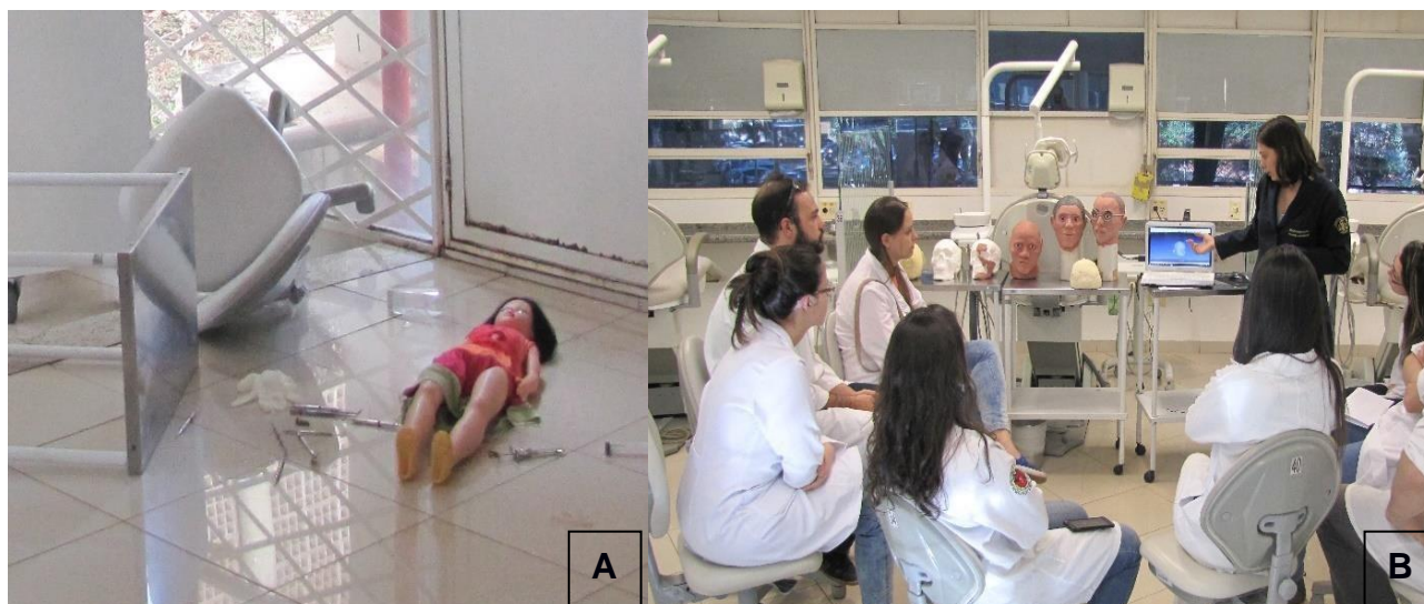
Figura 4 - (A): Local de crime simulado; (B): Estação didática

e documentos pertinentes 22 , sobre as quais aos princípios da Criminalística - observacionais, exercícios práticos são eficientes e benéficos 23 .