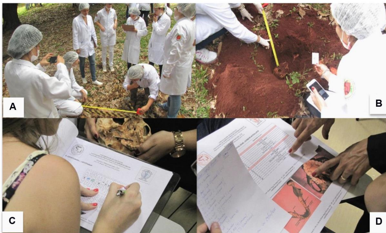
Figura 1 - Atividade prática de Arqueologia Forense e identificação odontolegal: (A) análise do local demarcado; (B) encontro de vestígio; (C) e (D): análise odontolegal post mortem , ante mortem e confronto

Em um segundo período didático, são distribuídos a cada grupo quatro prontuários odontológicos que diferem em formato e em conteúdo, sendo que apenas um destes prontuários é compatível com o encontrado no sítio escavado pelo grupo. Os estudantes devem estabelecer a identificação positiva ao prontuário correto e excluir os demais (figura 1). A atividade busca reiterar a possibilidade de atuação do cirurgião-dentista no meio pericial, concebendo a identificação de desconhecidos por meio de processos comparativos.