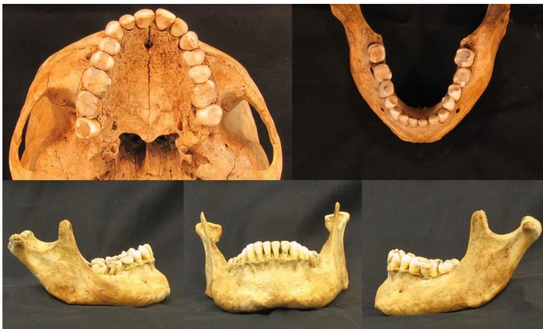
Figura 5 – Protocolo Odontolegal: sequência do protocolo fotográfico (arcos dentais), LAF/CEMEL, Ribeirão Preto, SP, Brasil.