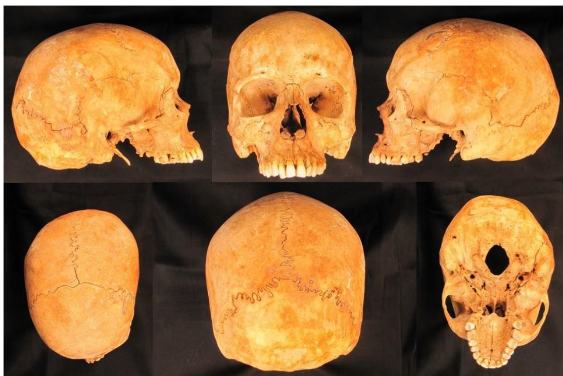
Figura 4 - Protocolo Odontolegal: sequência do protocolo fotográfico (crânio), LAF/CEMEL, Ribeirão Preto, SP, Brasil.